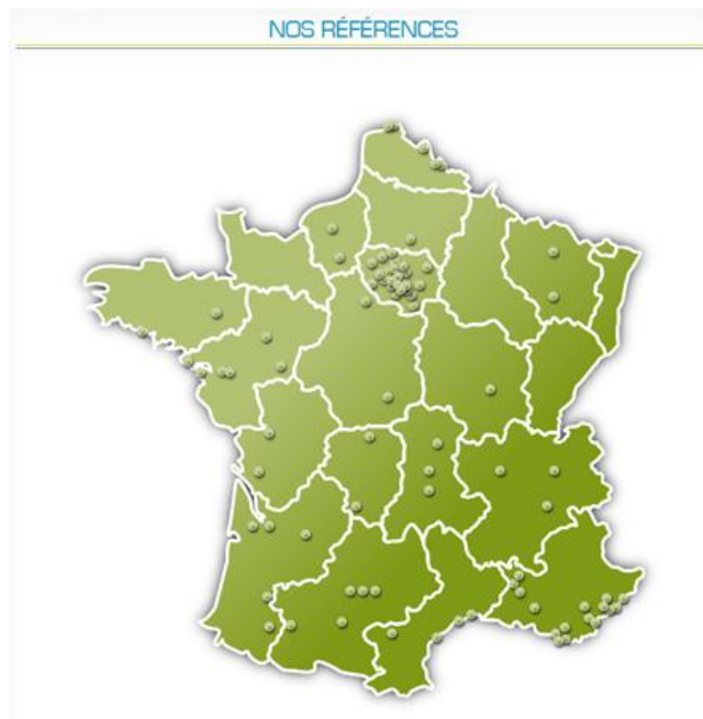
Figure 1. Nos références